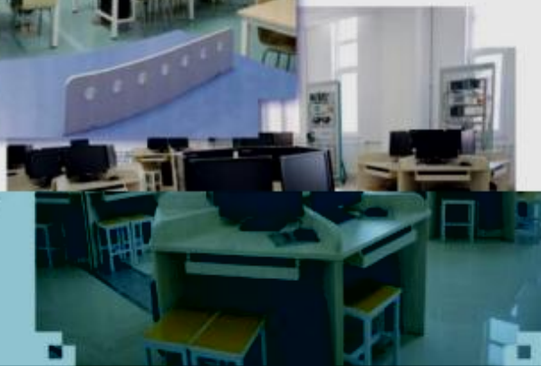
一体化课程教学设计 综合实训室