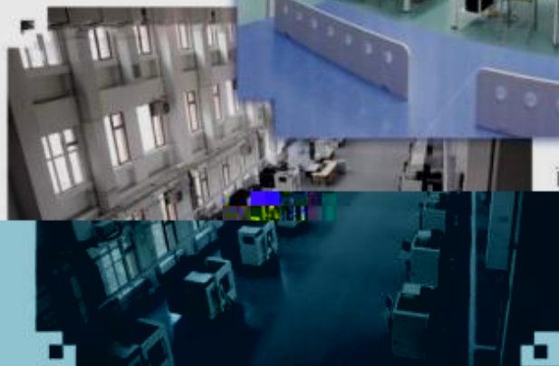
DMG 数控技术 训练场所