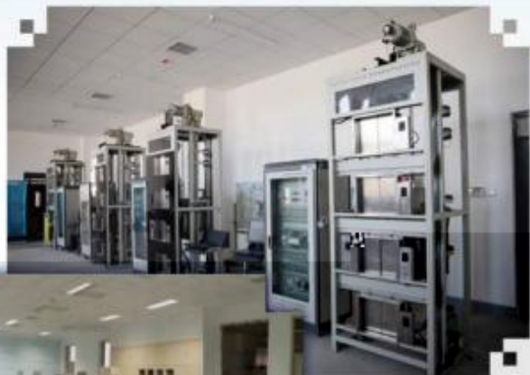
智能电梯安装调试 维护训练场所